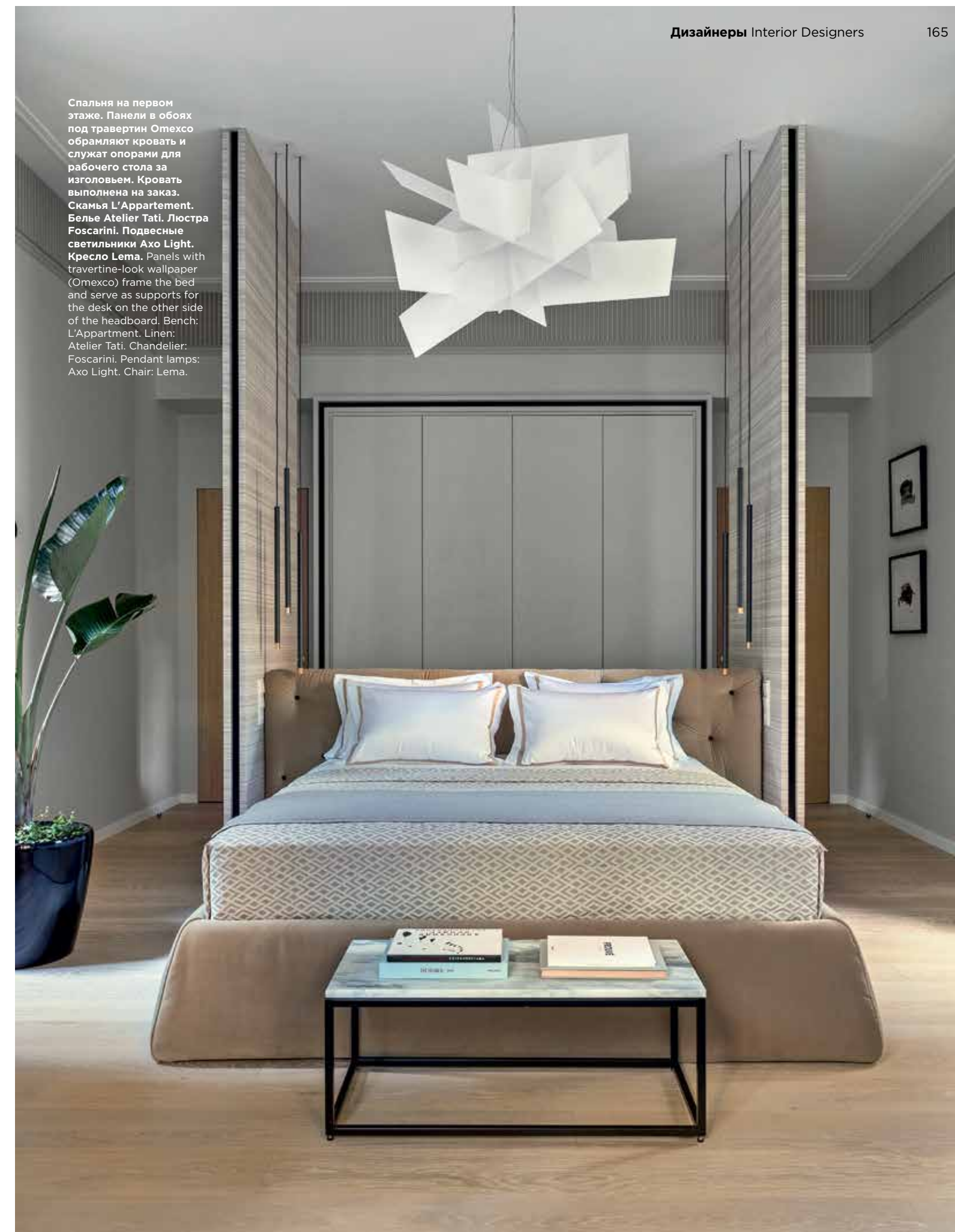
Спальня на первом этаже. Панели в обоях под травертин Omexco обрамляют кровать и служат опорами для рабочего стола за изголовьем. Кровать выполнена на заказ. Скамья L'Appartement. Белье Atelier Tati. Люстра Foscarini. Подвесные светильники Axo Light. Кресло Lema. Panels with travertine-look wallpaper (Omexco) frame the bed and serve as supports for the desk on the other side of the headboard. Bench: L'Appartement. Linen: Atelier Tati. Chandelier: Foscarini. Pendant lamps: Axo Light. Chair: Lema.