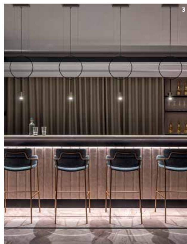
1. Бассейн. Молдинги подчеркивают и структурируют архитектуру. Кресла B&B Italia, столики Tacchini. 2. Кухня Giulia Novars. Бытовая техника Miele. 3. Барная стойка в помещении домашнего кинотеатра и дискотеки. Светильники Estiluz. Барные стулья Arrmet. 1. Swimming pool. Moldings on the walls accentuate the architecture. Armchairs: B&B Italia. Tables: Tacchini. 2. Kitchen: Giulia Novars. Home appliances: Miele. 3. Bar in media and disco room. Pendants: Estiluz. Bar chairs: Arrmet.